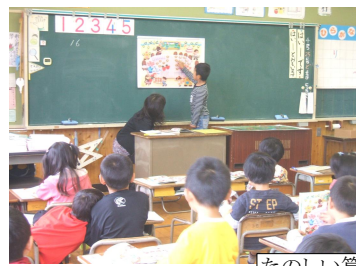
たのしい算数の学習

もう、すっかり学校に慣れ生き活きと活動しています。4月23日には、「一年生を迎える会」がありました。上級生のお兄さんやお姉さんたちと楽しく触れ合い、藤の木小の仲間入りができました。