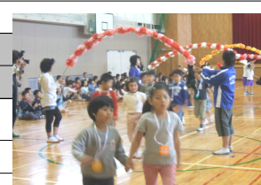
「一年生を迎える会」1年生だけで退場