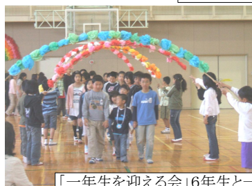
「一年生を迎える会」6年生と一緒に入場