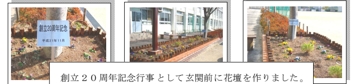
創立20周年記念行事として玄関前に花壇を作りました。