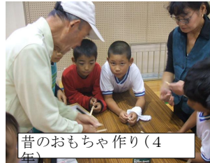
昔のおもちゃ作り（4年）

地域の方々が、どんぐりや竹など色々と準備をしてくださいました。ありがとうございました。子どもたちに地域の方々の温かいお気持ち、十分に伝わったことと思います。これからも、藤の木小学校の子どもたちが、域の方々と関わり、地域の子どものとしてすこやかに成長してくれることを望みます。